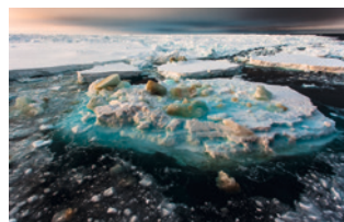
La rápida disminución del hielo marino y sus consecuencias interdisciplinarias