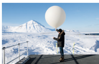
Interacciones aerosol-nube y retroalimentaciones radiativas