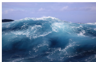
Balances de calor, agua dulce y carbono del Océano Austral y su respuesta al cambio climático