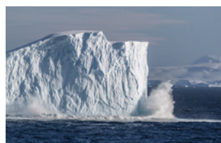
Variabilidad, fenómenos extremos y puntos de inflexión en un clima antártico cambiante