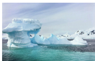
Deshielo de las plataformas de hielo e impacto costero